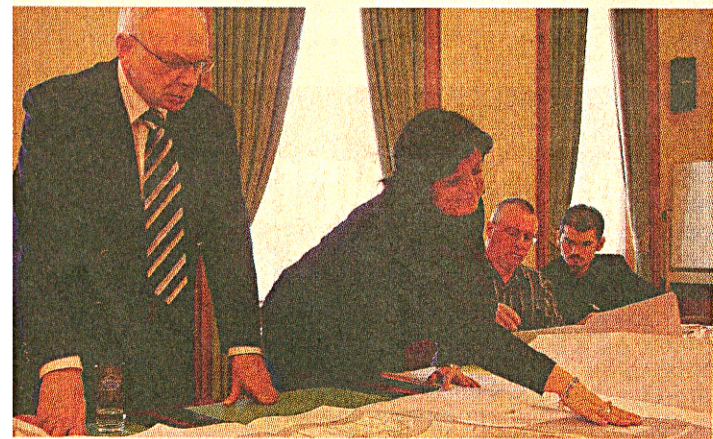
Le maire et la première échevine examinent les plans... ■ N.R.

Avant de donner son aval, le Collège échevinal a confronté le promoteur aux doléances mises par les habitants du Pic au Vent.